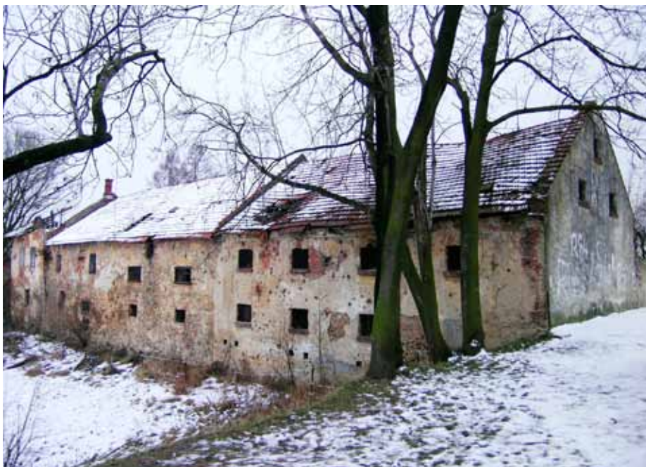
Obr. 2 Budova bývalé Wilczkovy sladovny a sýpky v roce 2008