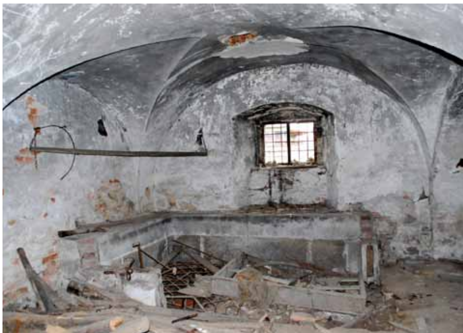
Obr. 3 Pozůstatek máčecího štoku v bývalé sladovně. Otvor v klenbě nad náduvníkem sloužil pro sypání ječmene k máčení (foto autor, 2009)