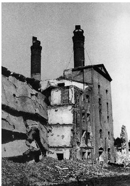
Bourání karvinského pivovaru 1958.